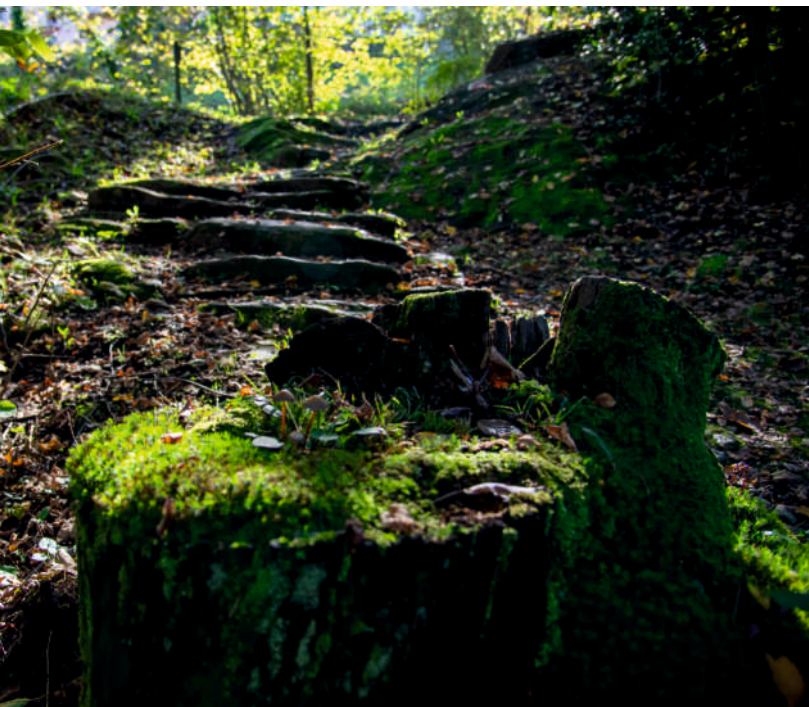
Scorcio del sentiero La Via del Ceneri