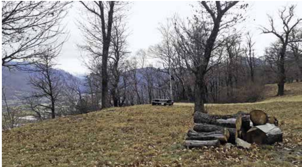
Selva castanile a Robasacco

Torna da protagonista lungo il percorso "La Via del Ceneri" il legno di castagno, ambasciatore del Ticino, scelto come materiale per la realizzazione di panchine di design, appositamente disegnate dall'architetto Rivola, e installate lungo l'itinerario. Utilizzando il legno di origine ticinese si è voluto focalizzare l'attenzione